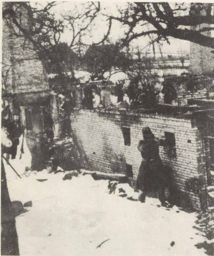
Fingeret kampscene i gård i ruiner i Øster-Dybbøl. J. Petersen.

for 1 Timestid, for at han kunde optage nogle Grupper i et veldædigt Øiemed. Jeg blev nu her med omtrent Halvdelen af Feltvagten No. 2, circa 30 Mand samt Lt Christensen, og lod Resten af Compagniet gaae tilbage til Barakkeleiren paa den Sydlige Side af Chausseen, hvor Compagniet fik 1 Officers-Barakke samt 4 Barakker (1 Række) til Underofficerer og Mandskab. Barakkerne vare kun halv færdige, utætte og tildels uden Halm. Efter Forløb af omtrent 1 3/4 Time, havde Petersen fuldendt 2 Grupper af Compagniet.