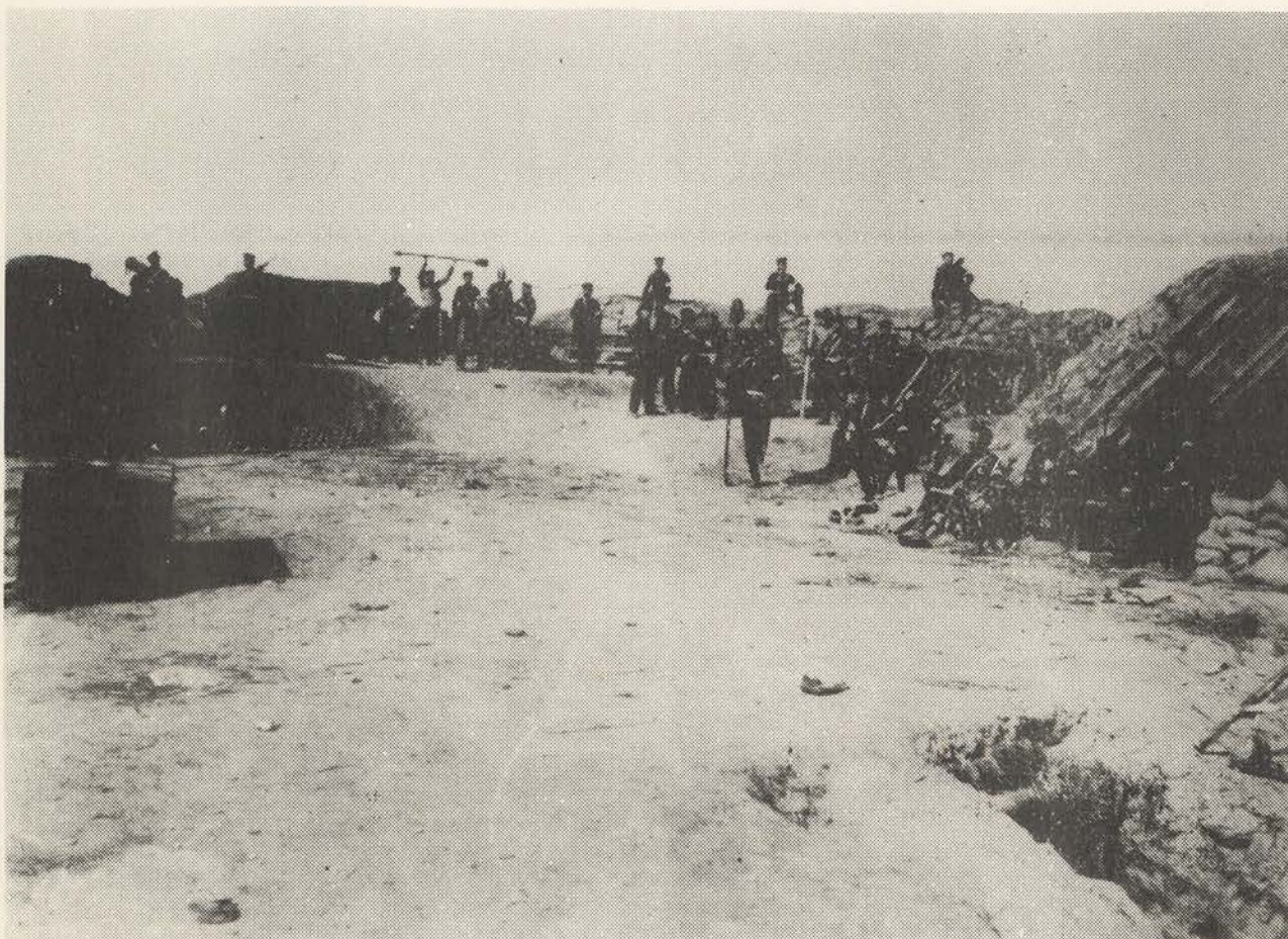
Schanze VII, innere Ansicht. C. Junod.