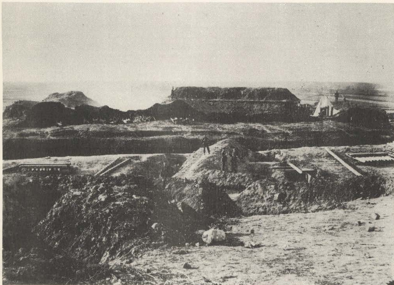
Düppler Schanze No 9. Heinrich Graff.

Se bl.a. Erich Stenger: Siegeszug der Photographie. 1950, s. 127.