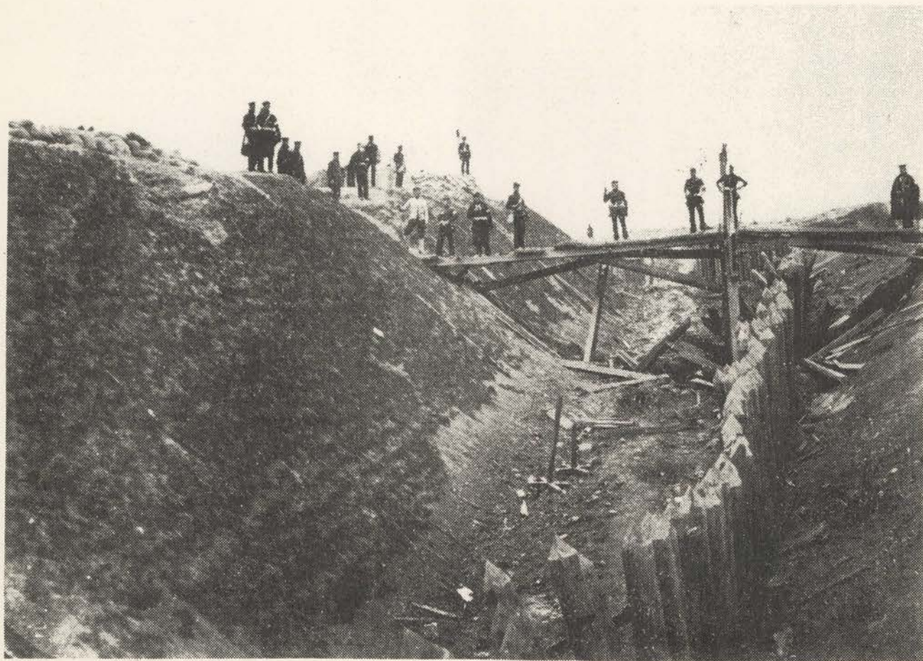
Düpler Schanzen nach dem Sturm; Schanze nr. 4. F. Brandt.

f. 1.7.1823 - d. 3.6.1891 i Flensburg, var fra begyndelsen af 1850'erne fotograf i Flensburg, og var ikke blot en dygtig atelierfotograf, men udmærkede sig fra begyndelsen af 1860'erne både æstetisk og teknisk som prospektfotograf. Han var således fortrolig med at fotografere udendørs, da krigen udbrød i 1864. Brandt fulgte tyskernes fremrykning og fotograferede slagmarker og befæstningsanlæg fra Oeversee over Dybbøl og videre til Als samt nordpå i Jylland. Også nogle få optagelser på preussiske skibe samt talrige soldatergruppebilleder skyldes ham.