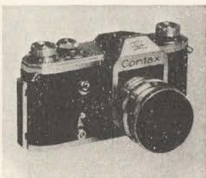
Første spejlreflex m. søgerprisme var Contax D fra de forhv. Zeiss Ikon fabriker i Dresden (1952). 1950